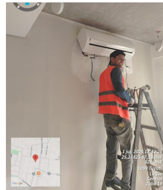
Montaje de muebles de cocina – Colocación de pisos y revestimientos – Climatización (evaporadores)